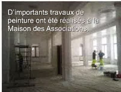
D'importants travaux de peinture ont été réalisés à la Maison des Associations.