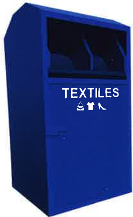
Colonne à textile