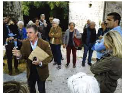
Réunion de quartier à la rencontre et l'écoute des Saint-Ambroisiens.

La Commune a investi dans une épareuse pour maintenir la propreté à moindre coût.