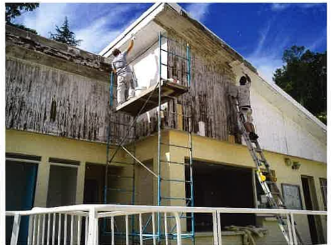
État de la piscine avant les travaux de rénovation.