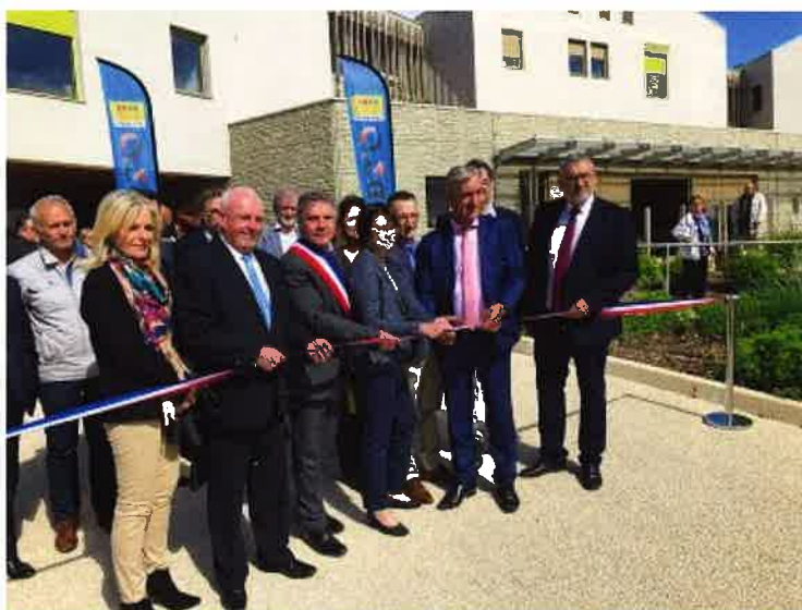
Inauguration des Jardins de la Cèze (EHPAD) le 15 mai 2018