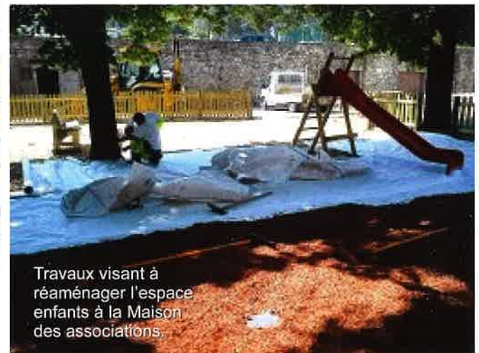
Travaux visant à réaménager l'espace enfants à la Maison des associations.