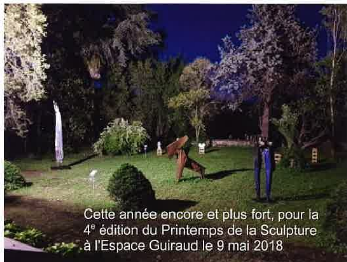
Cette année encore et plus fort, pour la 4 e édition du Printemps de la Sculpture à l'Espace Guiraud le 9 mai 2018