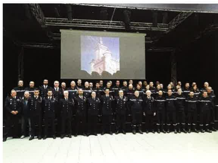
Le Centre de Secours des Sapeurs Pompiers a fêté son 70ème anniversaire au Tremplin le 14 avril 2018