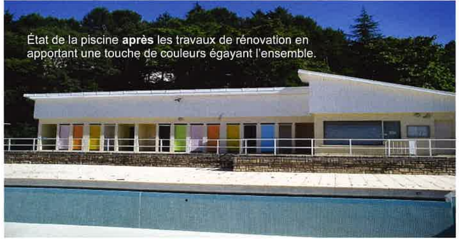
État de la piscine après les travaux de rénovation en apportant une touche de couleurs égayant l'ensemble.

Le 28/05/2018 le chantier de réhabilitation de la station de surpression de la Vivaraise a été réceptionné. Réalisés par la société Canonge et sous la maîtrise d'œuvre du cabinet CEREG, ces travaux ont été subventionnés par l'Agence de l'Eau Rhône Méditerranée Corse ainsi que le Conseil Général du Gard.