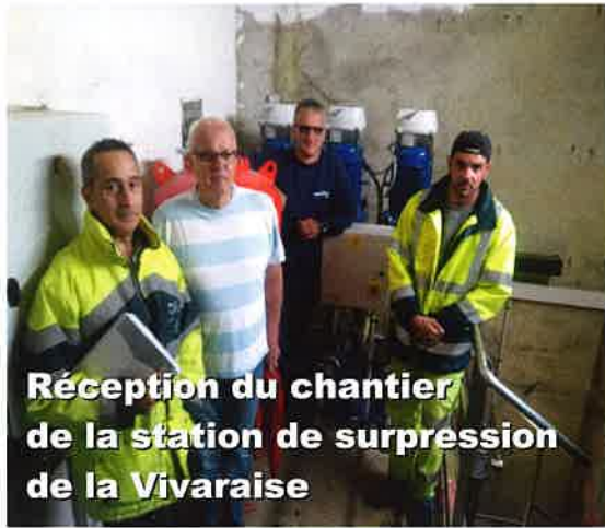
Réception du chantier de la station de surpression de la Vivaraise