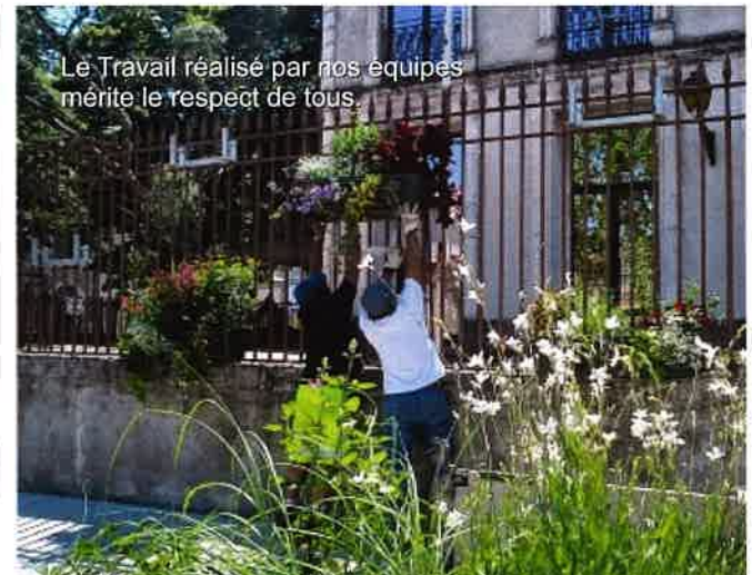
Le Travail réalisé par nos équipes mérite le respect de tous.