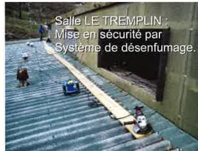
Salle LE TREMPLIN : Mise en sécurité par Système de désenfumage.