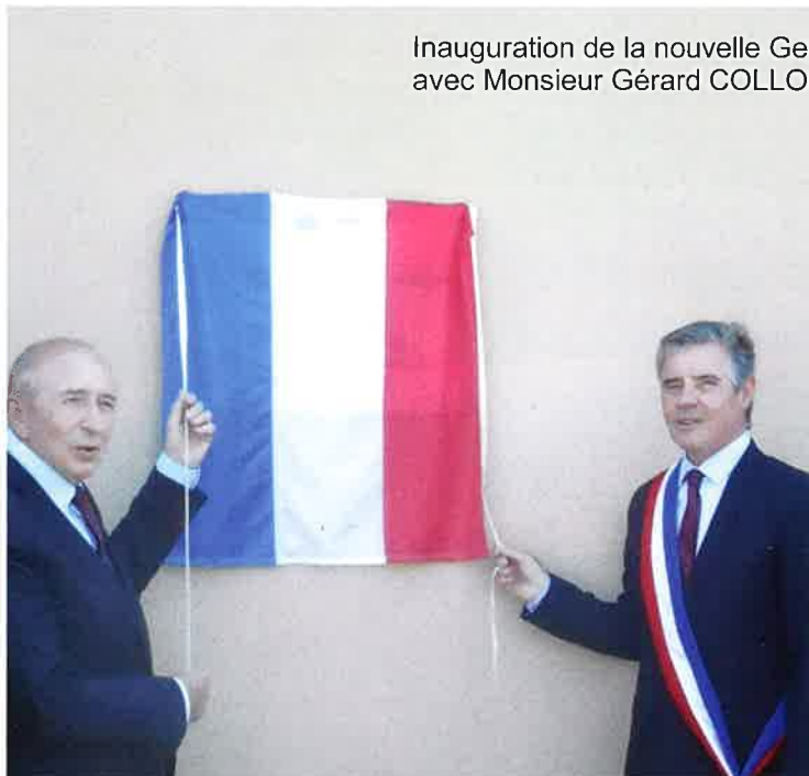
Inauguration de la nouvelle Gendarmerie le 24 mai 2018 avec Monsieur Gérard COLLOMB - Ministre de l'intérieur.